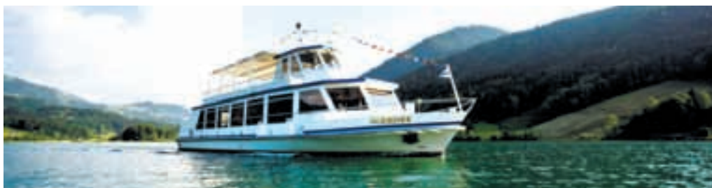
MS Ägerisee in Fahrt

www.aegerisee-schifffahrt.ch Tel. 041 728 58 50