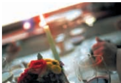
Festlich und verzaubernd