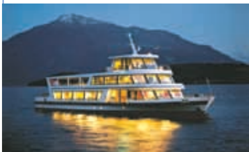
Gemütliches Abendessen auf See von Zug nach Arth und anschliessender Besuch des Theaters Arth.

Auch die Zugerland Reisen AG fährt Sie ins Theater Arth und zurück. Reservation unter Tel. 041 728 58 68