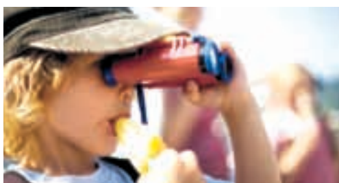
«Goldgräber» auf Schatzsuche