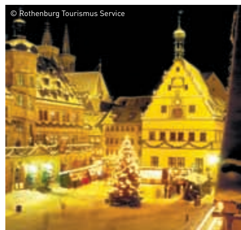
Weihnachtlich geschmücktes Rothenburg