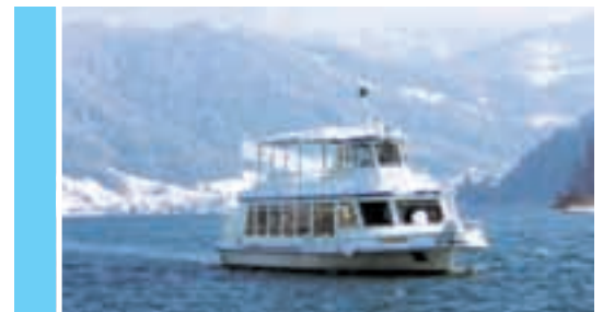
Gemütlich und genussvoll Silvester auf See