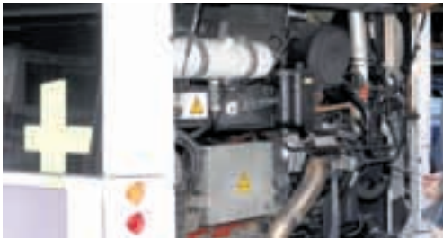
Die zukunftsorientierte Hybrid-Technik.