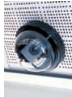
Vandalismus-sichere Dom-kameras sorgen für eine gute Überwachung.