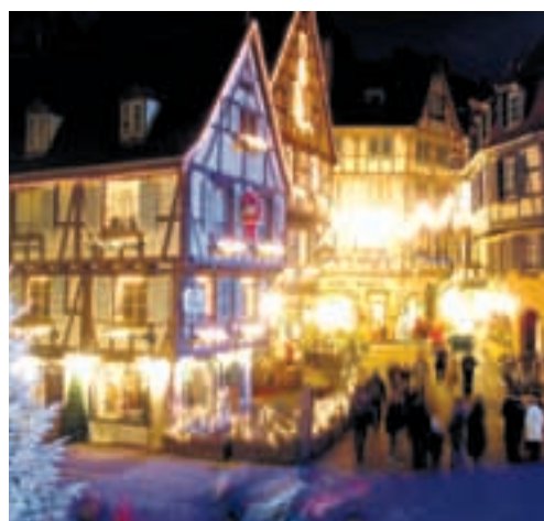
Romantische Gassen in Colmar

Haben Sie ein anderes Wunschziel vor Augen? Die Zugerland Reisen AG fährt Sie und Ihren Verein auch an «Ihren» Lieblingsweihnachtsmarkt.