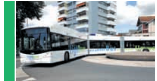
Der Hybrid Bus – ein Blick in die Zukunft