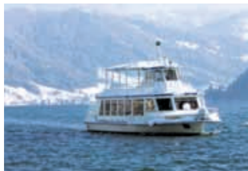
MS Ägerisee in winterlicher Idylle