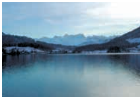
Winterstimmung auf dem Ägerisee

Für eine sichere Heimfahrt empfehlen wir «Nez rouge». Lesen Sie den Artikel auf Seite 14 – 15.