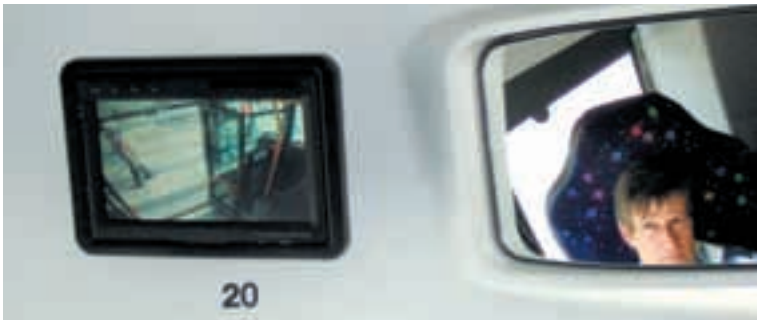
Oberhalb des Fahrplatzes befindet sich ein für den Fahrgast klar sichtbarer Überwachungsmonitor.

In den Fahrzeugen mit Videokameras wurden praktisch keine Vorkommnisse mehr verzeichnet. Die ZVB prüft deshalb die Möglichkeit, 2008 noch weitere Fahrzeuge mit diesem Überwachungssystem auszurüsten.