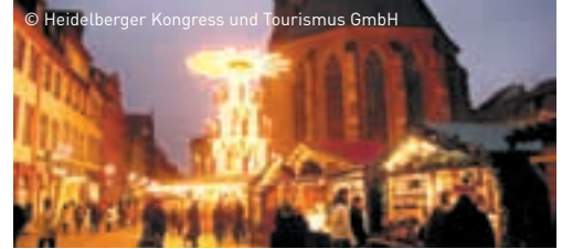
Markt am Hauptplatz in Heidelberg